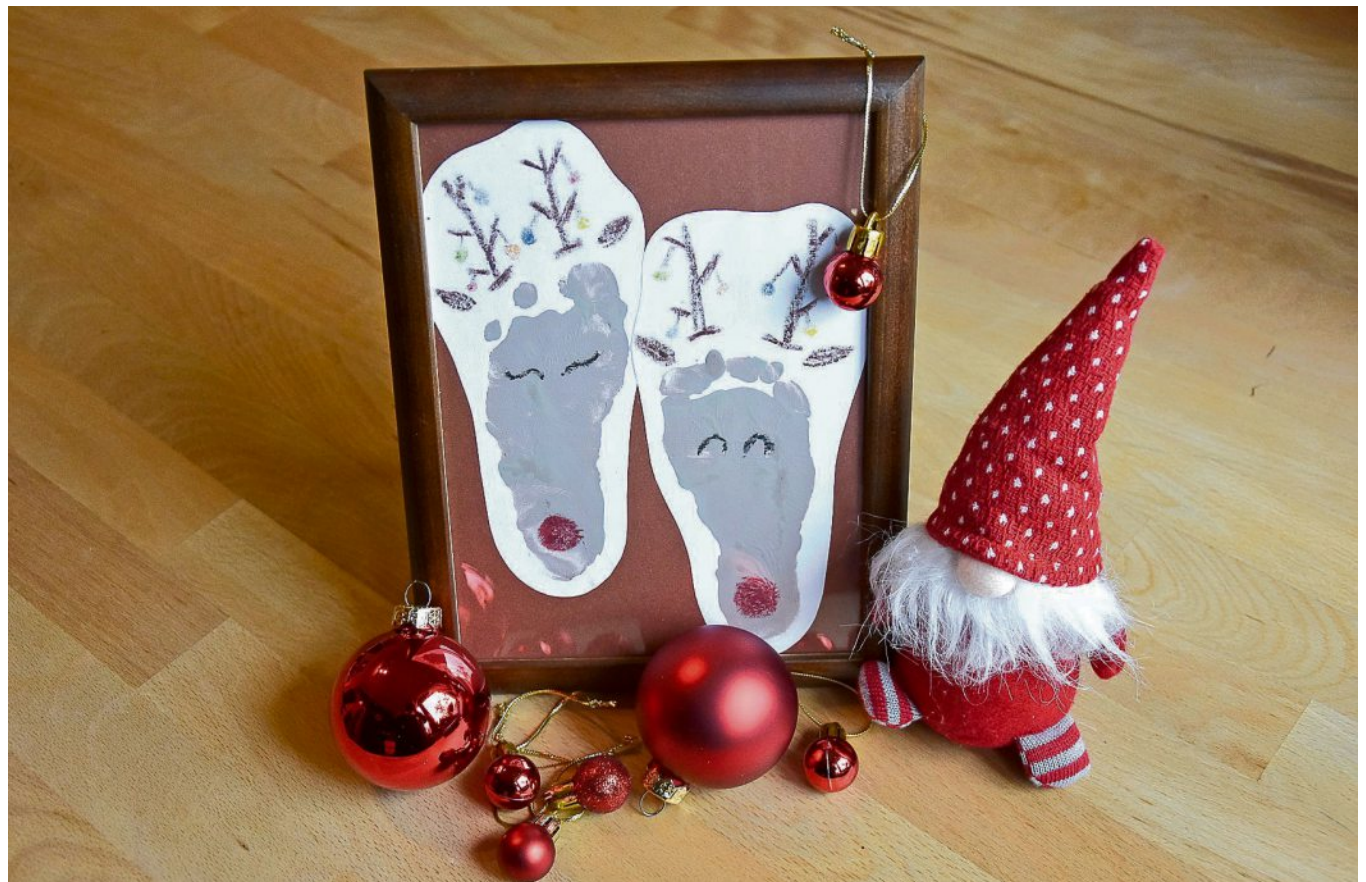
Das Team der Dorstener Zeitung freut sich auf Kreatives von kleinen und großen Lesern.

Aber auch Erwachsene können sich beteiligen: Wie wäre es, schöne Kindheitserinnerungen an die Weihnachtszeit zu teilen? Freuen würde es uns auch, wenn Sie uns an lustigen Anekdoten und Begebenheiten rund um Weihnachten teilhaben las-