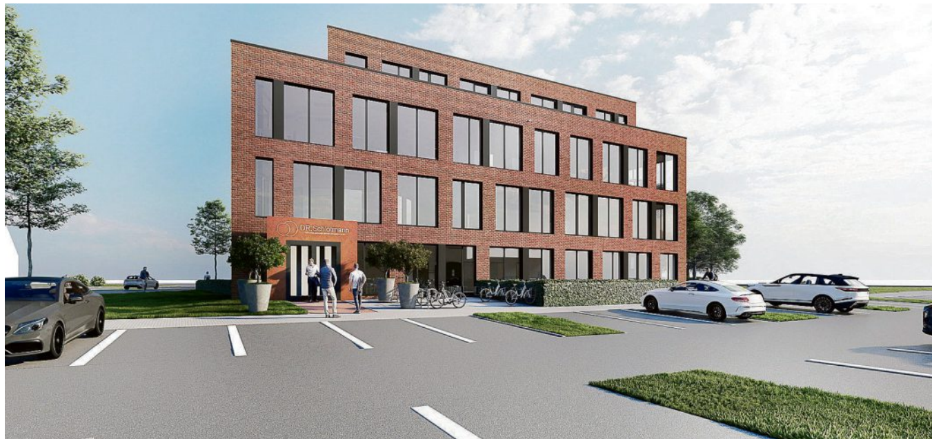
In Münster entsteht derzeit ein (zahn-)medizinisches Versorgungszentrum.