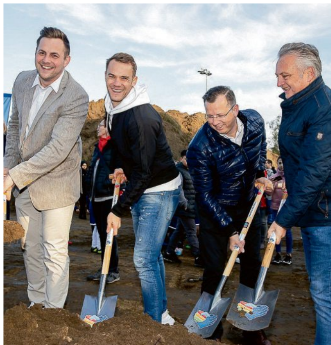
Grundsteinlegung 2019, u.a. mit Manuel Neuer und Rainer Thieken.

funktionsraum mit einer lichten Höhe von ca. sechs Metern. Im Mehrzweckraum wird ein großer Raum für Gruppenaktivitäten und Veranstaltungen eingerichtet, welcher im Tagesbetrieb auch in zwei Bereiche durch eine flexible Trennwand unterteilt werden kann.