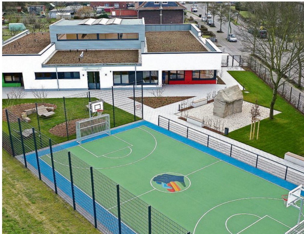
Auch Sporteinrichtungen gehören zum Kinder- und Jugendhaus.