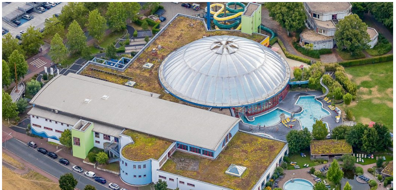
Vielen Menschen gefällt besonders das Spaßbad mit mehreren Rutschen.