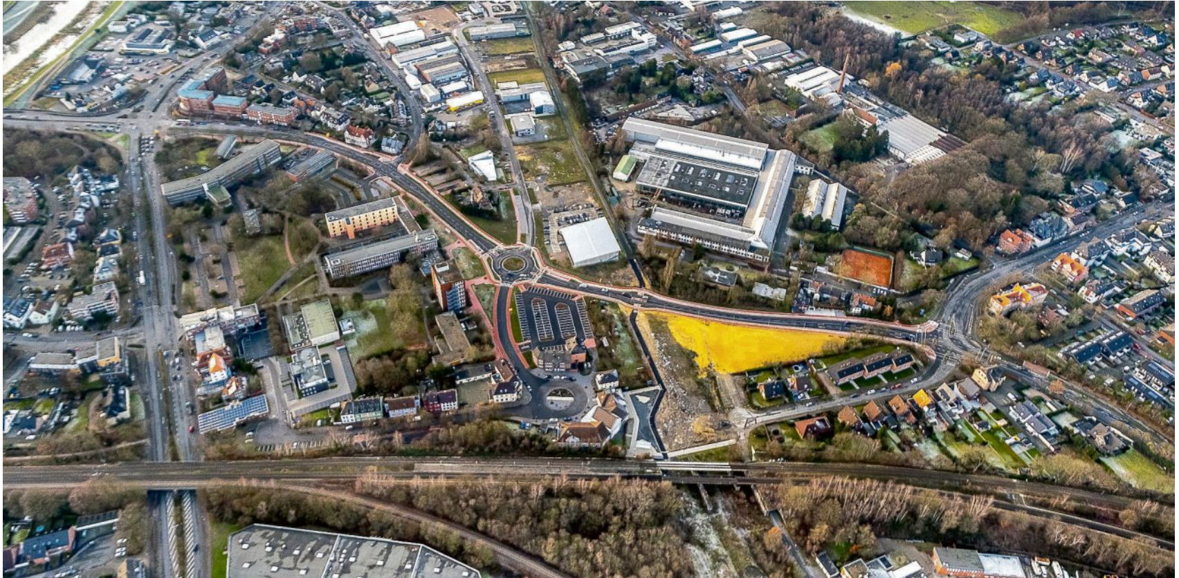
Auch das Gewerbegebiet Marienstraße ist in das geförderte Landes-Projekt aufgenommen worden.