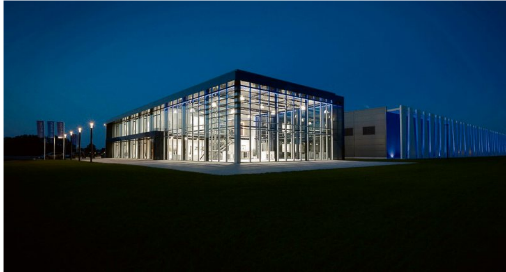
Das Sicon Firmengebäude bei Nacht in Gescher.

Beratung & Visualisierung: Unser erfahrenes Team steht Ihnen von Anfang an zur Seite, um die optimale Lösung für Ihr Projekt zu planen. Wir bieten erstklassige Beratung und nutzen hochmoderne Visualisie-