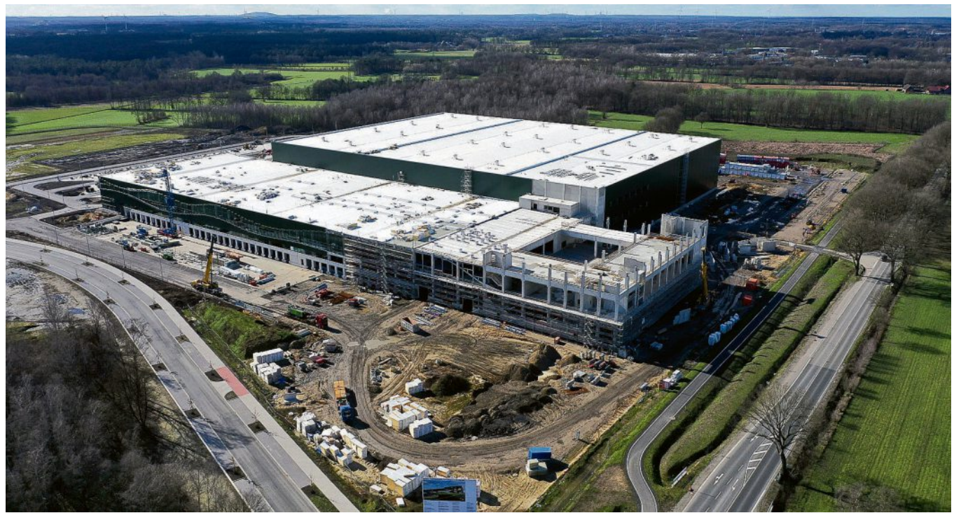
Das neue Logistikzentrum erstreckt sich über 70.000 Quadratmeter.

Beim Bau des „Positive Footprint Warehouse“ wurde besonderer Wert auf die Wiederverwendung von Materialien, die Schonung von Ressourcen und die Reduzierung von Abfällen gelegt. Beispielsweise wurden die Betonfundamente der ehemaligen Zeche Wulfen, die sich auf dem Gelände befanden, recycelt und im neuen Bauwerk wiederverwendet. Zudem wird die Einrichtung über ein geothermisches Heiz- und Kühlsystem, begrünte Dächer, Solarpaneele, einen Biodiversitätspark und eine