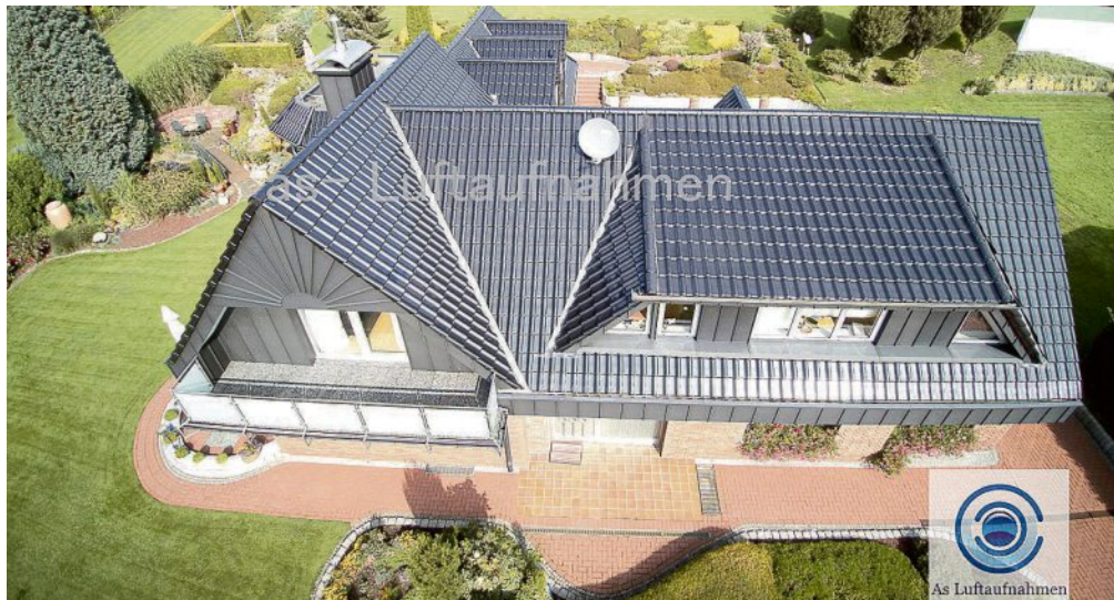
Referenzobjekt in Essen: Dachsanierung (Ziegeldach) mit Ausbauten und Winkelstehfalz.

Qualität: Bei Dachtechnik Sicon erhalten Sie Topqualität