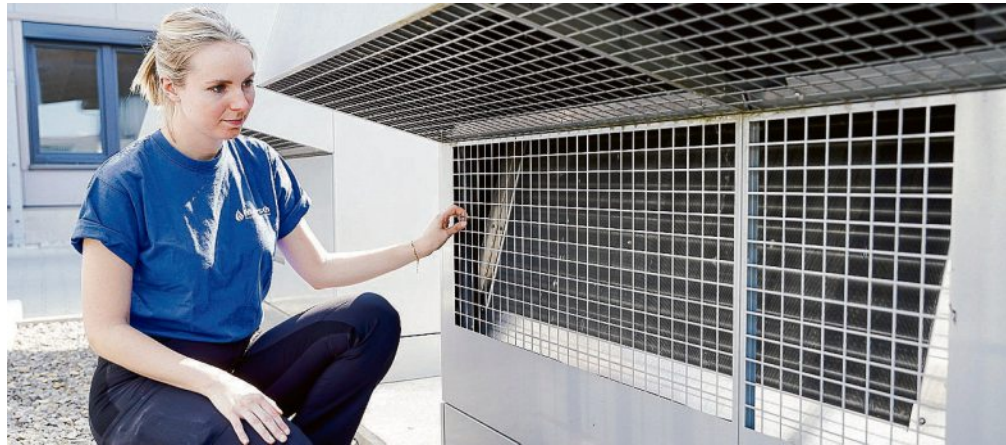
Sind Wärmepumpen zeitgemäß? Und welche Voraussetzungen muss ein Haus erfüllen, um diese effizient zu nutzen?

Ob die vorhandene Haustechnik schon fit genug für den Wärmepumpenbetrieb ist, lässt sich mit dem sogenannten 50-Grad-Temperatur-Test eigenhändig über-