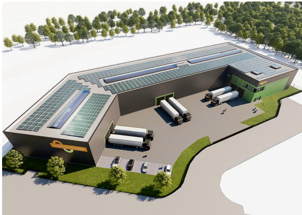
So soll die neue Loick-Produktionshalle aussehen.

GRAFIK THIEKEN ARCHITEKTEN + INGENIEURE GMBH