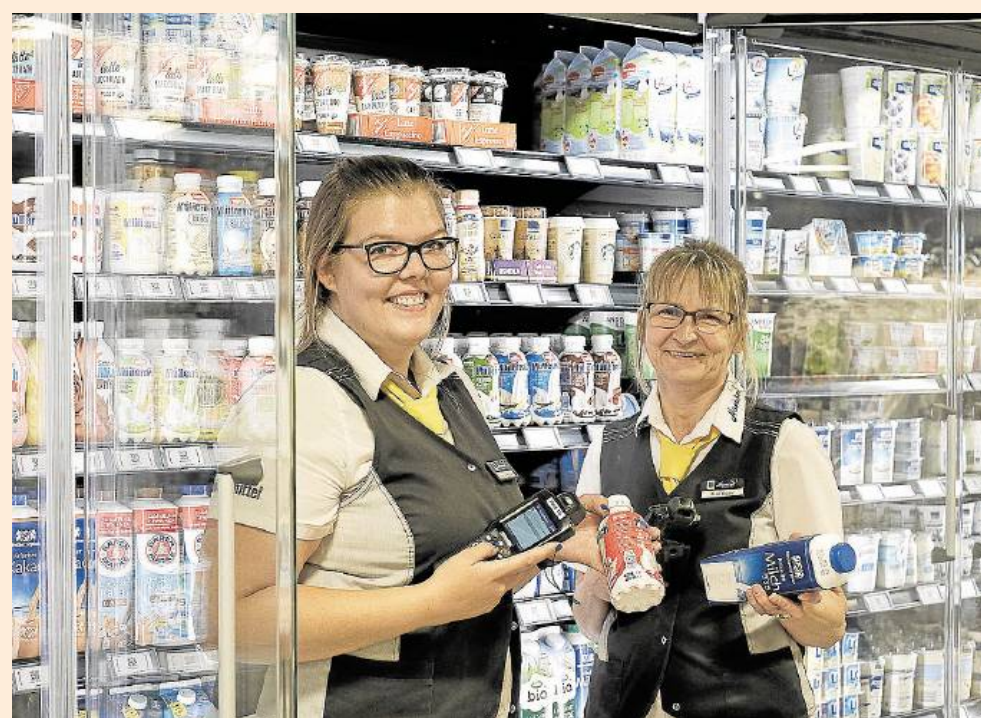
Das Honsel-Team arbeitet auf Hochtouren, damit zur Eröffnung der neu renovierte Markt die Kunden voll und ganz überzeugt.