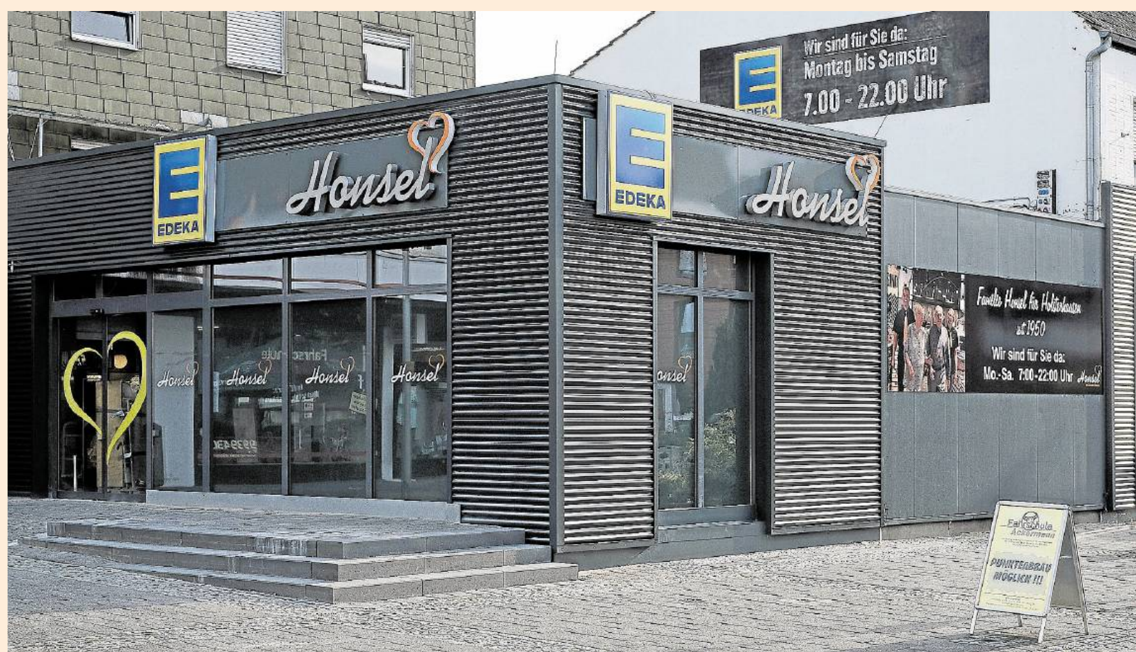
Die neu gestaltete Fassade des Edeka Marktes ist einladend geworden.